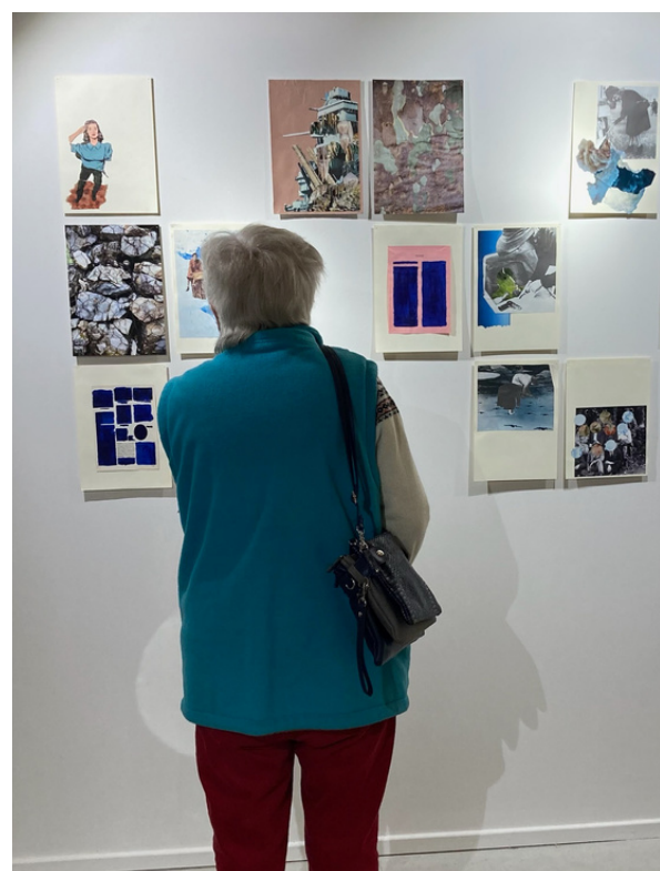
Exposition "Liebe Résistance", Musée de la Résistance du Vercors et le Matrimoine-en-Diois Vassieux-en-Vercors