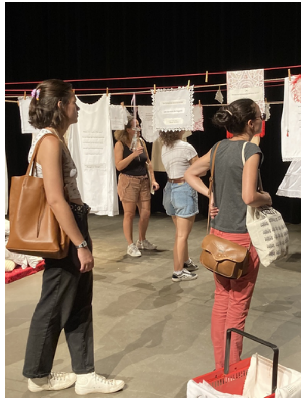
Installation et performance "43 coussins et une corde à linge, rêverie féministe" Rize de Villeurbanne et Si/si, les femmes existent