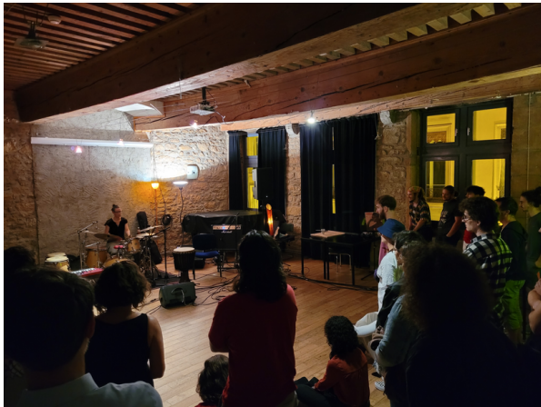
Projet musical "Contemporaines", Cefedem, Lyon