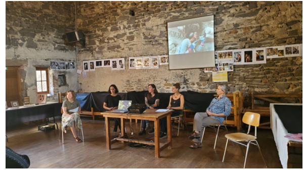
Table-ronde "Le matrimoine de la pierre en construction" Les Brayauds, Saint-Bonnet-près-Riom