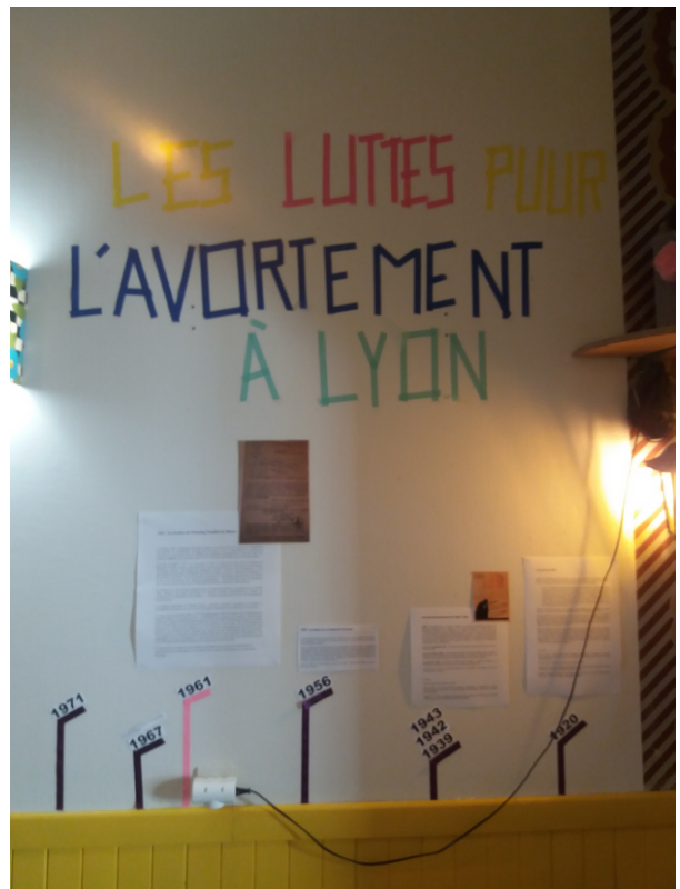
Exposition "Les luttes pour le droit à l'avortement à Lyon" Planning Familial 69, Lyon