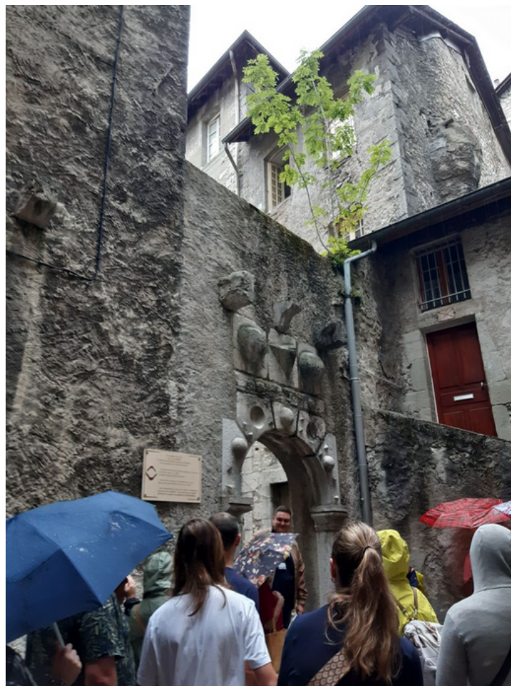
Visite guidée "Sur les traces des femmes résistantes en Savoie" Mairie de Chambéry