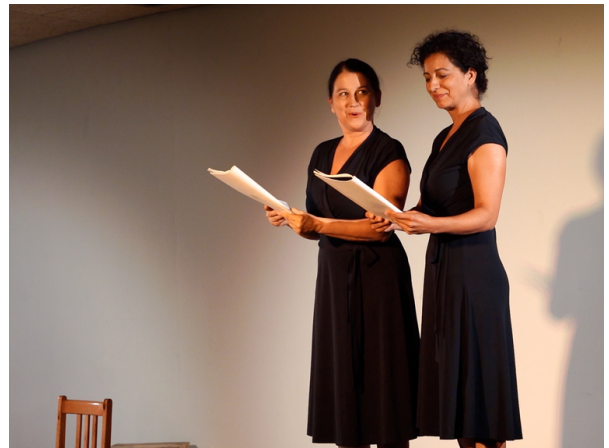
Spectacle "Je m'appelle Etty", médiathèque de Villeurbanne