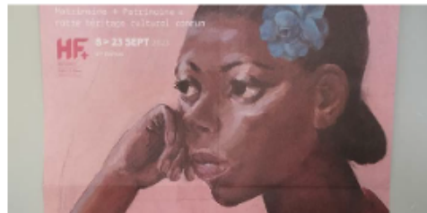
L'affiche officielle des Journées du matrimoine 2023.

La balade est gratuite et sur réservation au 04 75 22 24 51. Le programme complet des Journées du matrimoine est disponible à l'Office du tourisme. Une visite de Lalouvesc aura lieu dimanche 17 septembre à 14 h 30, durant laquelle seront présentées les grandes figures matrimoniales ayant fait l'histoire du village.