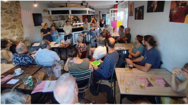
Rencontre et conférence "Qui était Odette Laguerre, féministe bugiste ?" Collectif Entre-autres, Artemare