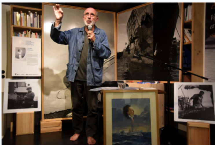
Laurent Girault-Conti