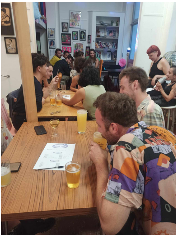
Time's Up géant, blind test et atelier Théâtre de L'Elysée et le Café Rosa, Lyon